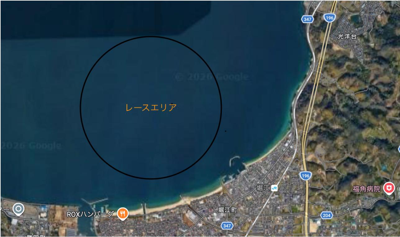
添付図1 レースエリア